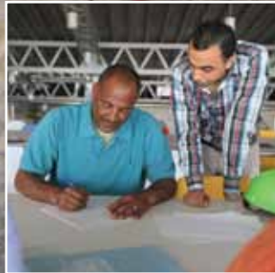
مئات العائلات الفلسطينية تتسارع لتملك منزلها في روابي