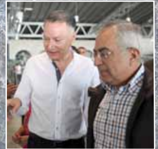
فياض: "روابي تعزز صمود الشعب الفلسطيني"