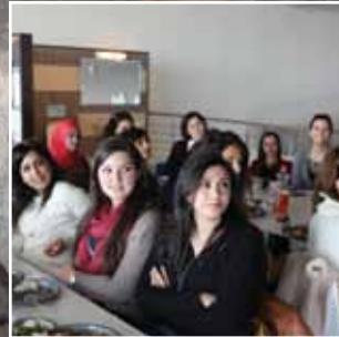
سيدات روابي احترفن التميز