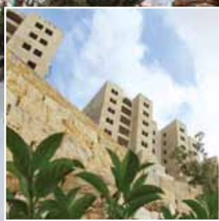
إصدار سندات الطابو لمئات الشقق