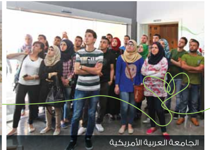
الجامعة العربية الأمريكية