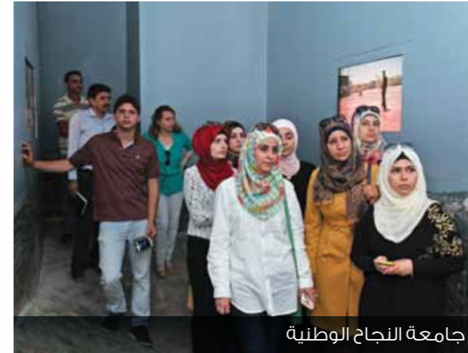
جامعة النجاح الوطنية