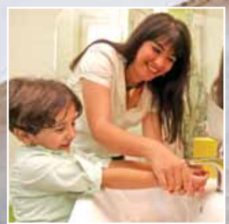
وأخيراً حل مشكلة المياه