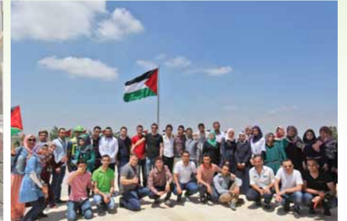
جامعة فلسطين التقنية، خضوري