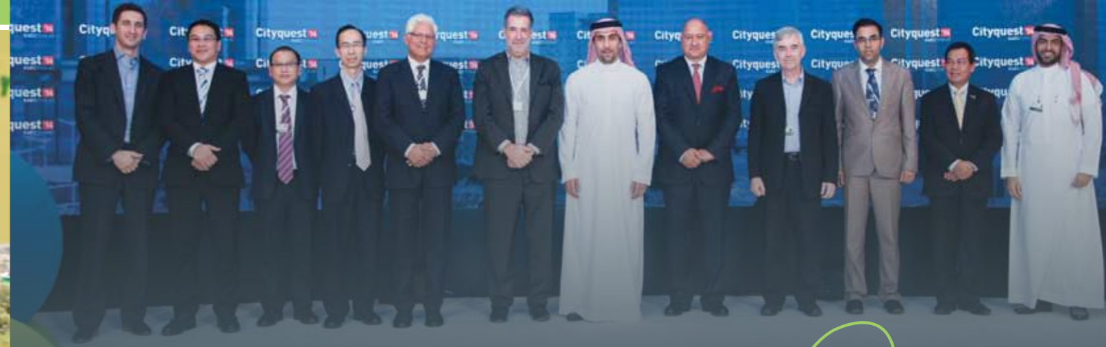
الحفل الختامي للمنتدى المملكة العربية السعودية