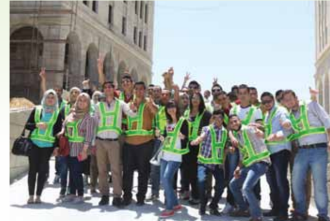
جامعة النجاح الوطنية

سيواصل العمل على إيجاد برامج تدريبية مع مختلف الجامعات المحلية بما يحقق الهدف الرئيسي المتمثل في توفير فرص للنمو بالقدرات الشخصية والمهنية للطلبة على حد سواء. وبشكل مستمر تتواصل زيارات طلاب الجامعات المحلية للمدينة من كافة محافظات الوطن، للتعرف على المدينة كتطبيق عملي لمختلف تخصصاتهم، حيث تشكل هذه الزيارات فرصة للطلاب للاطلاع على مشاريع نوعية على أرض الواقع، ومعايشة سوق العمل، إضافة إلى تطبيق ما قاموا بتعلمه من أسس التخطيط الحضري والبيئي، والتصميم الإسكاني، والإدارة والتسويق، واستخدام أحدث التكنولوجيا، وغيرها العديد من المجالات.