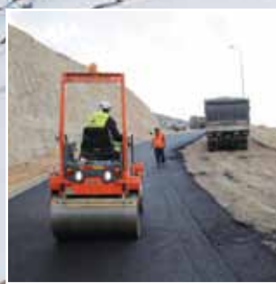
بدء مشاريع تعبيد الطرق